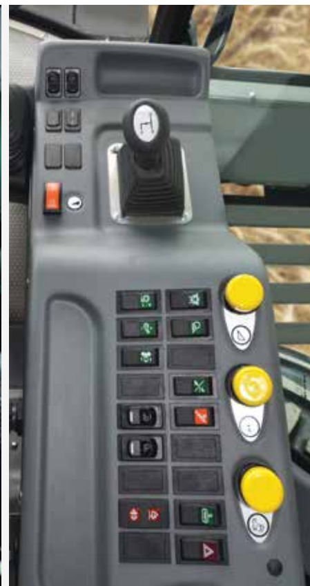
Hlavní ovládání z přístrojové desky

Kabina Komfort je navržena tak, aby poskytovala řidiči ideální a produktivní pracovní prostředí, přináší prvotřídní pohodlí a dokonalý komfort i po mnohahodinové práci. Řidič si ze své polohy udržuje úplný přehled o sklízecí mlátičce díky systému Agrotronic a palubnímu počítači. Ovládací prvky jsou ergonomicky uspořádány pro jednoduché a snadné ovládání sklízecí mlátičky. Pneumatically odpružené sedadlo, nastavitelná a vyhřívaná zpětná zrcátka a vynikající výhled patří ke standardní výbavě.