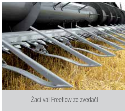
Žací vál Freeflow ze zvedací