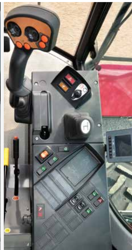
Hlavní ovládání z přístrojové desky

Kabina Elegance je navržena tak, aby poskytovala řidiči ideální a produktivní pracovní prostředí. Přináší prvotřídní pohodlí a dokonalý komfort i po mnohahodinové práci.