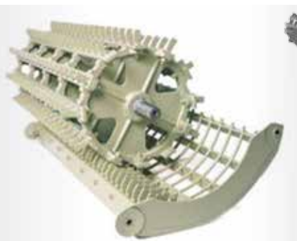
Mláticí buben a koš pro sklizeň rýže na přání