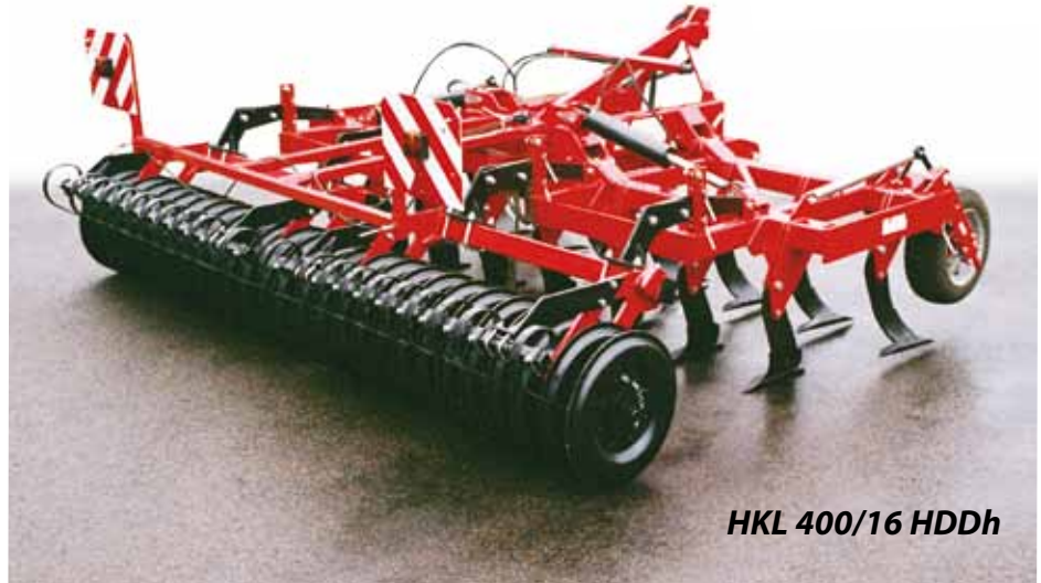
HKL 400/16 HDDh

ist geeignet für Auflockerung des Bodens bis zum 25 cm tief. Bei der Auflockerung entsteht zur intensiven Zerstörung des Bodenobersteiles, welchen ist möglich weiter zu bearbeiten. Deshalb ist die Kombination mit dem Nachläufer mit gewellten Scheiben empfohlen. Aber es ist möglich auch andere Varianten der Nachläufer zu wählen.