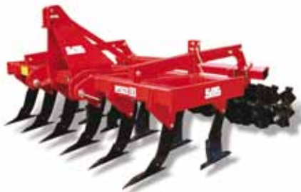
HKL 300/12 Vv